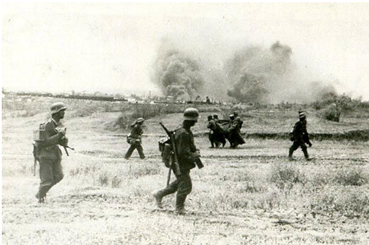
Группа немецких пехотинцев во время атаки в районе Сталинграда. 1942 г.

В районе северо-восточнее Котельниково наши артиллеристы отразили две танковые атаки противника и уничтожили 3 тяжелых и 5 средних немецких танков. Н-ская часть, оборонявшая один населенный пункт, в ожесточенном бою с противником уничтожила 4 танка и истребила более 100 гитлеровцев. «Правда», 28.08.1942 г.