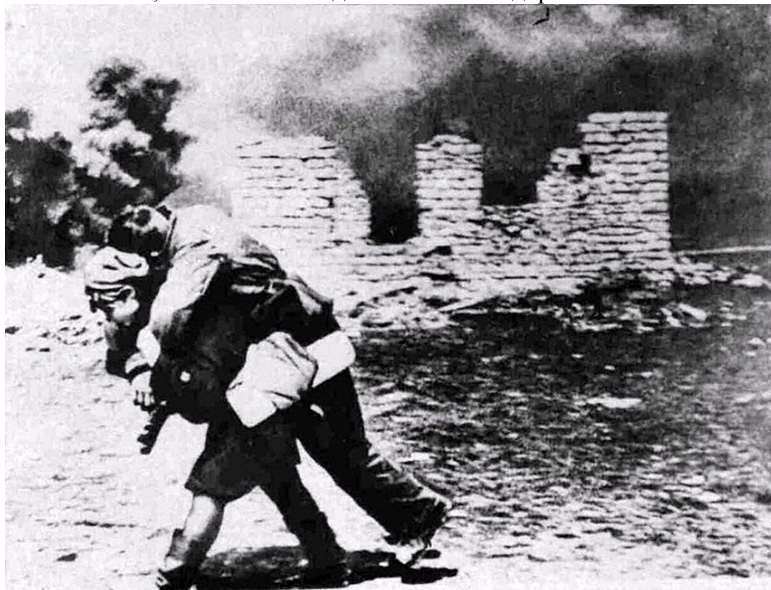
Военный санитар переносит раненого бойца Красной Армии. Сталинград. 1942 г.

Одновременно шла борьба с танками и мотопехотой врага. Несмотря на сильное противотанковое прикрытие немцев, нашим подразделениям удалось уничтожить 4 вражеских танка, 15 пулеметов, 10 минометов и до 950 немецких солдат и офицеров. Кроме того, танкисты подбили и сожгли 60 машин с вражеской пехотой, спешившей сюда в качестве подкрепления.