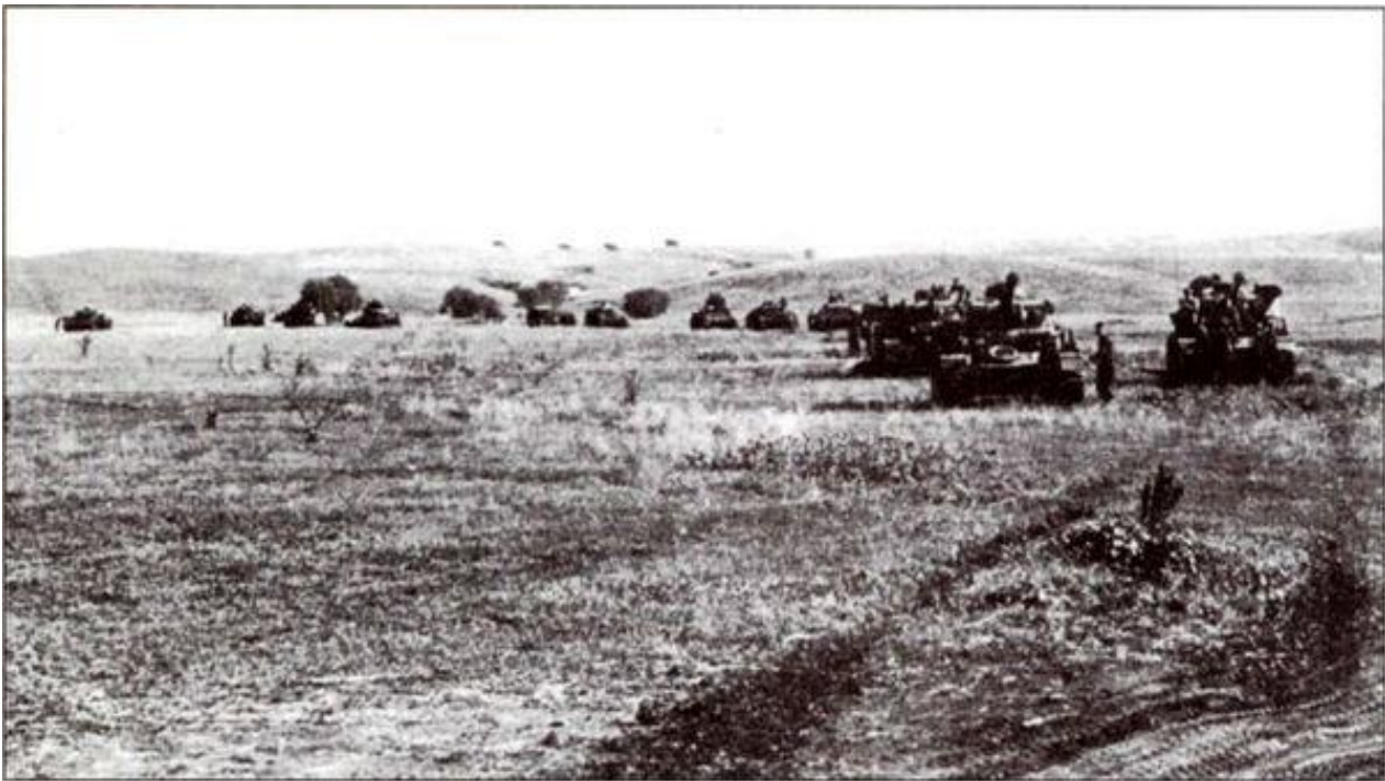
Немецкие танки 4-й танковой армии на подступах к Сталинграду. Лето 1942 года.