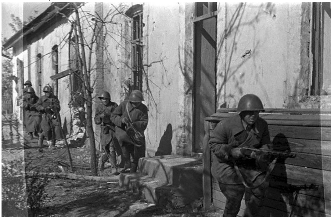
Гвардейцы разведывательной роты лейтенанта Левченко во время разведки на окраинах Сталинграда. 1942 г.