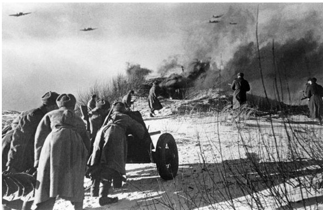
Артиллеристы во время боя.