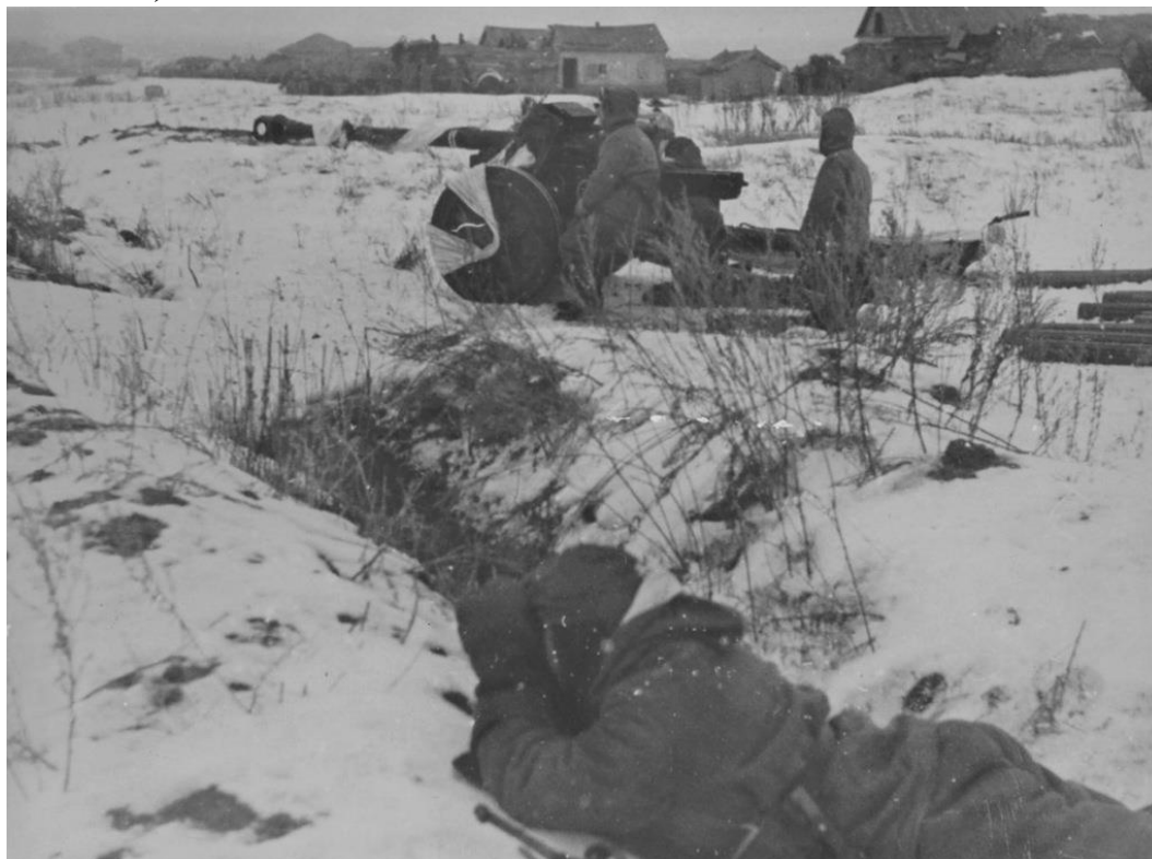
Немецкая 75-мм пушка PaK 40 на окраине деревни под Сталинградом.