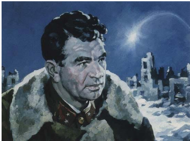
В. И. Чуйков

62-я армия оборонялась на линии Ильевка — Суровикино. К вечеру 27 июля войскам 64-й армии (командующий генерал-майор М. С. Шумилов, заместитель — генерал-лейтенант В. И. Чуйков) удалось закрепиться на восточном берегу рек Чир и Дон и остановить противника.