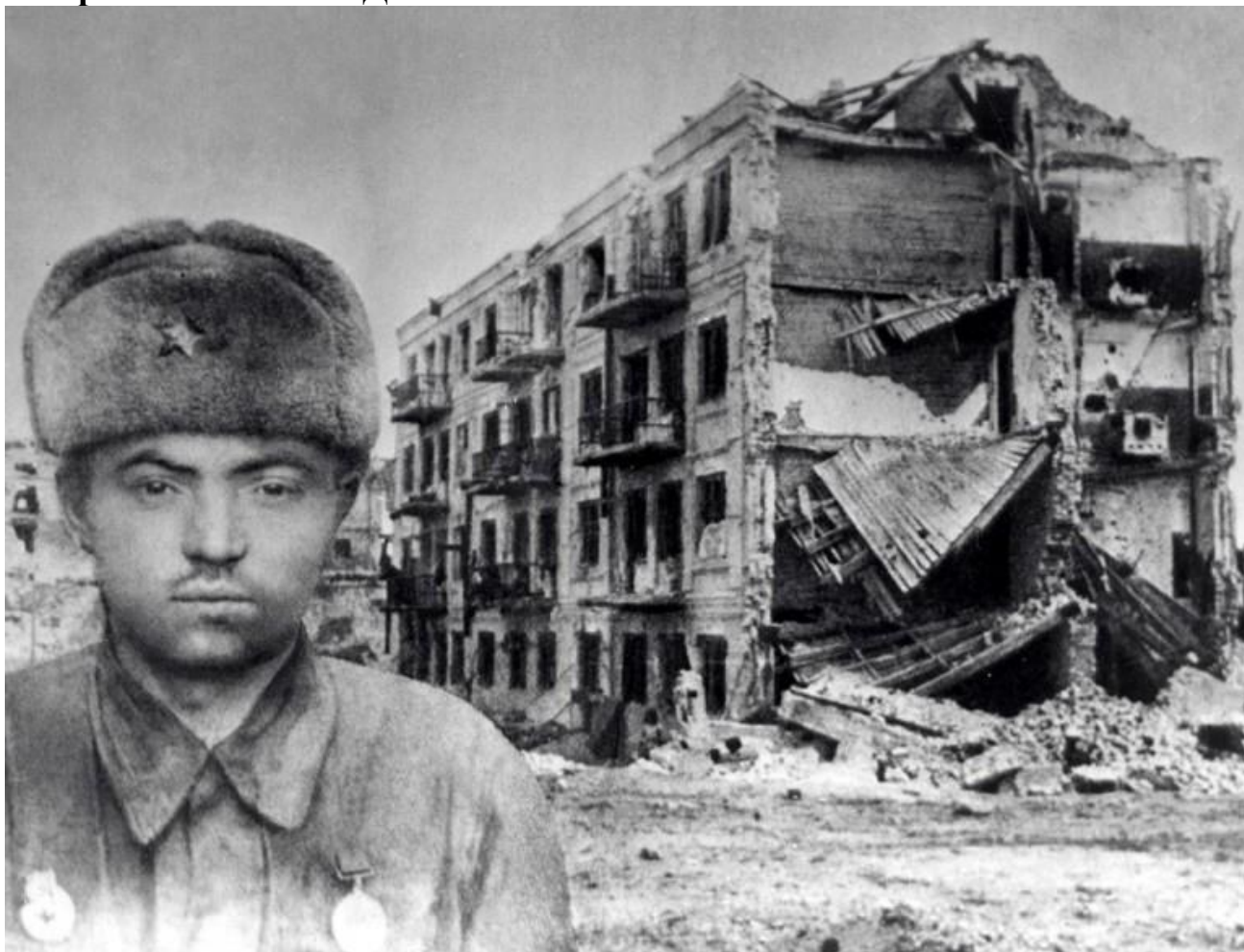
Сержант Я. Ф Павлов и его дом.

Именно 26 сентября 1942 года, по свидетельству историков, началась героическая оборона дома на площади 9 января, который потом стал всемирно известен как Дом Павлова.