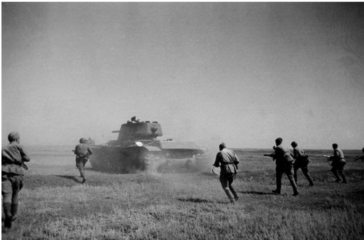
Атака советских танков KV-1 Сталинградского фронта при поддержке пехоты.