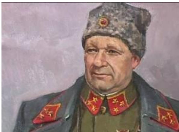
Генерал М. С. Шумилов