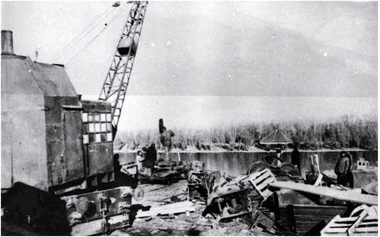
Эвакуация завода за Волгу. Сталинград. 1942 г.