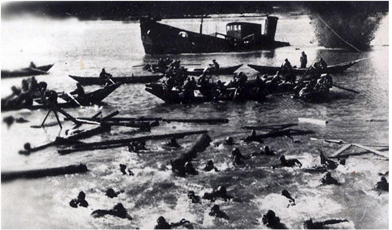
На переправе через Волгу в Сталинград. 1942 г.