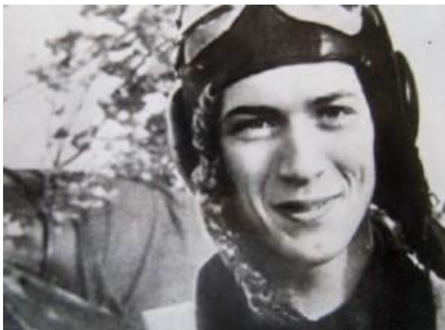
Летчик Борис Гомолко