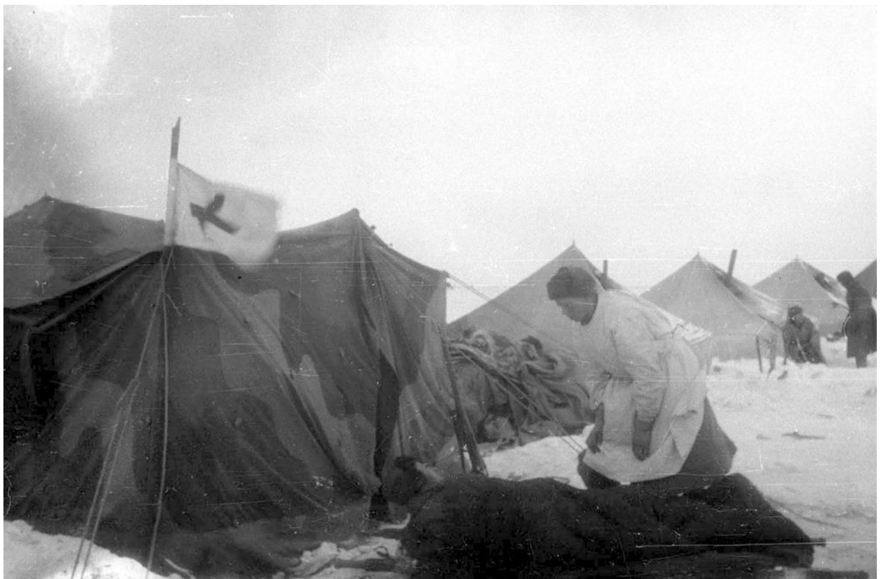
Советский полевой госпиталь в районе Сталинграда. 1942 г.