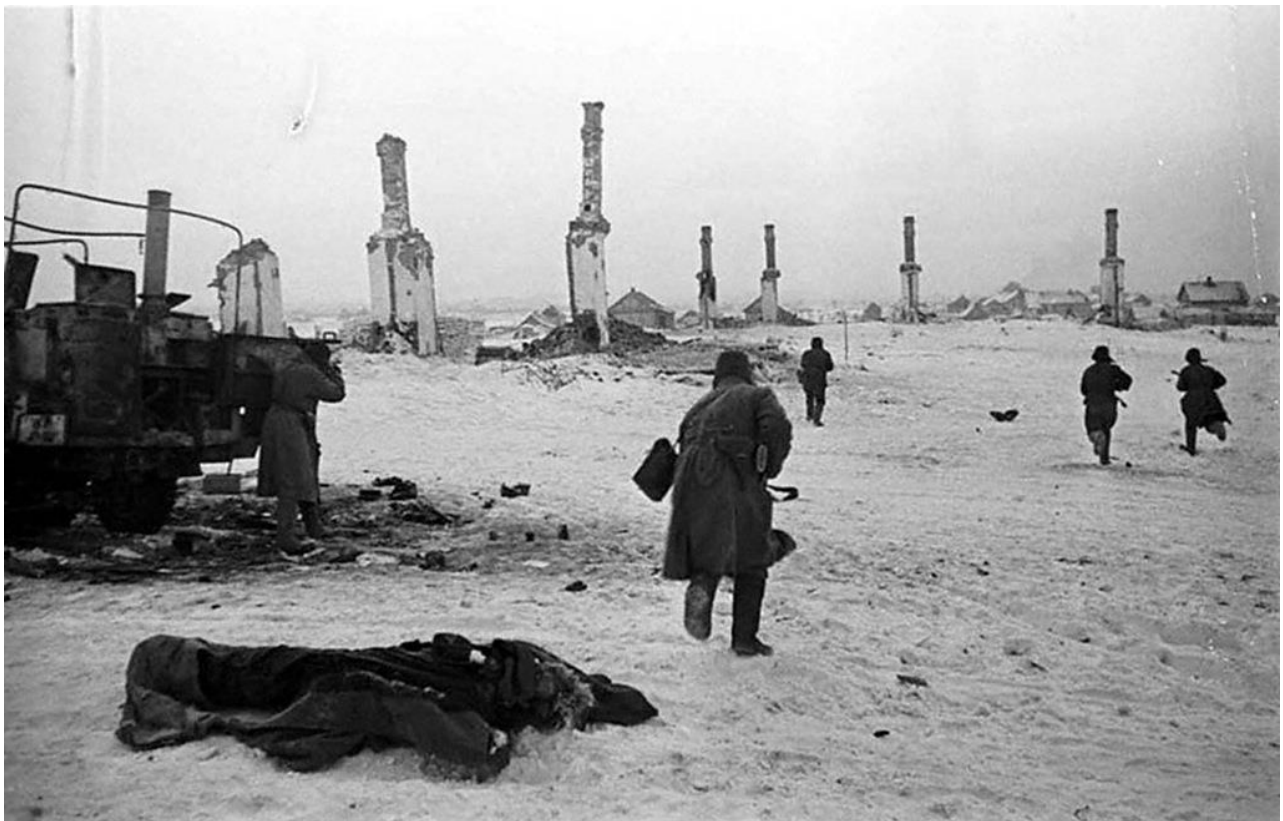
Бой в районе Сталинграда. 1942 г.