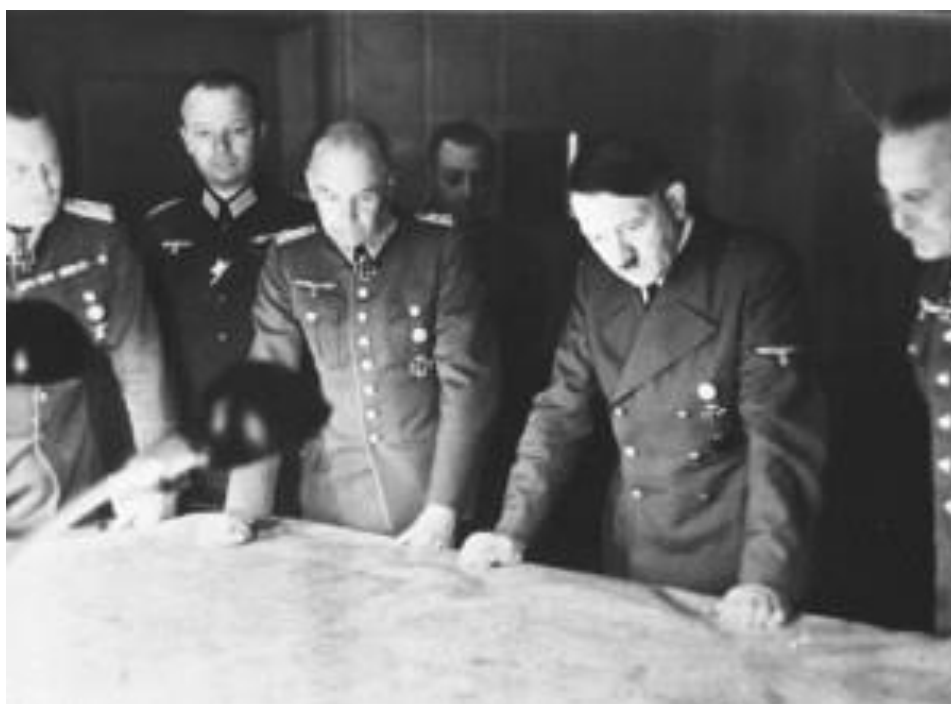
Генерал-полковник Франц Гальдер справа от Гитлера