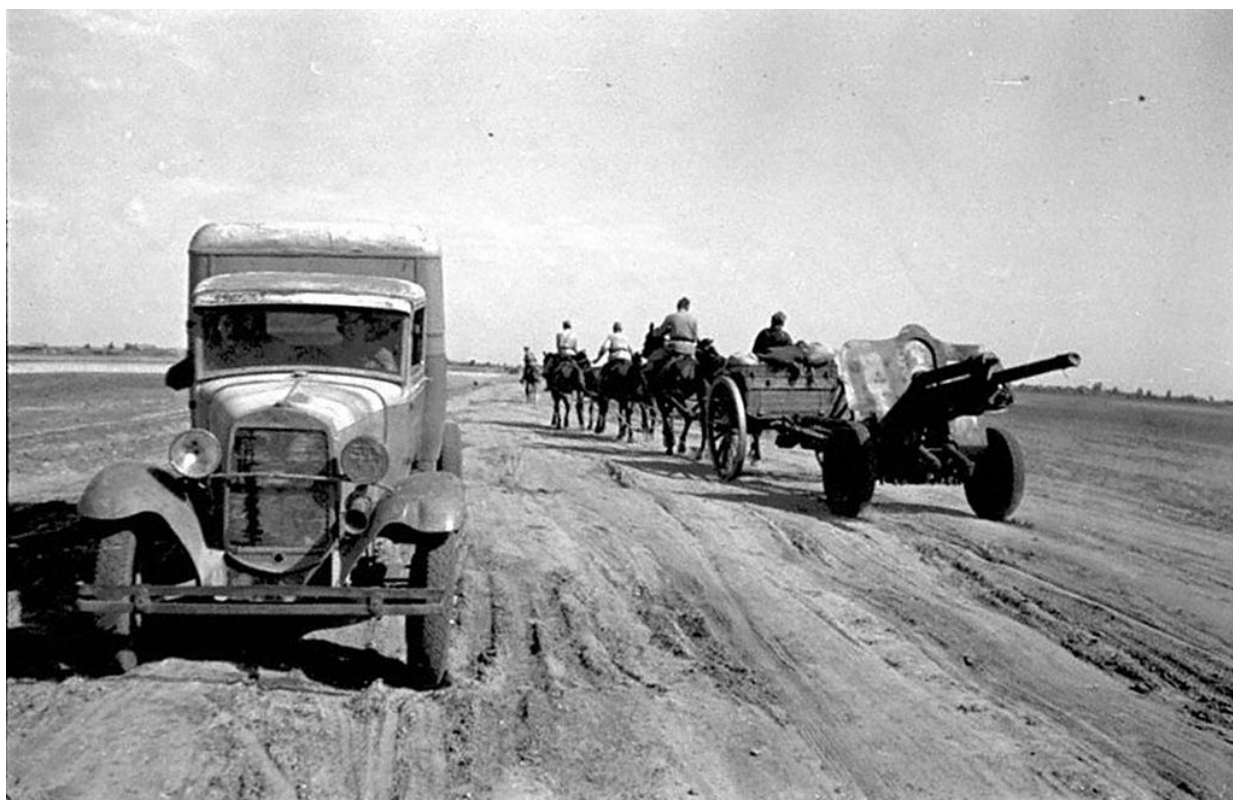
Одна из частей Красной Армии в районе Сталинграда. 1942 г.