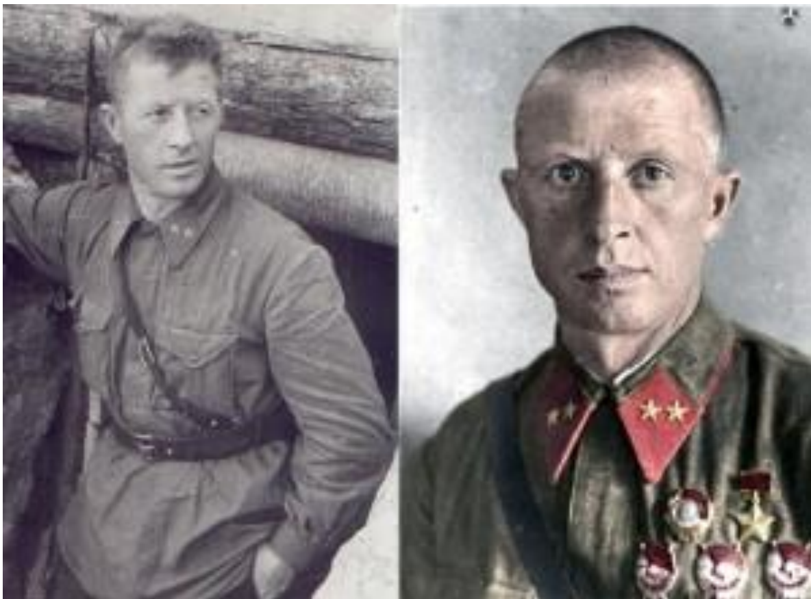
А. И. Родимцев, командующий 13-й гвардейской стрелковой дивизией