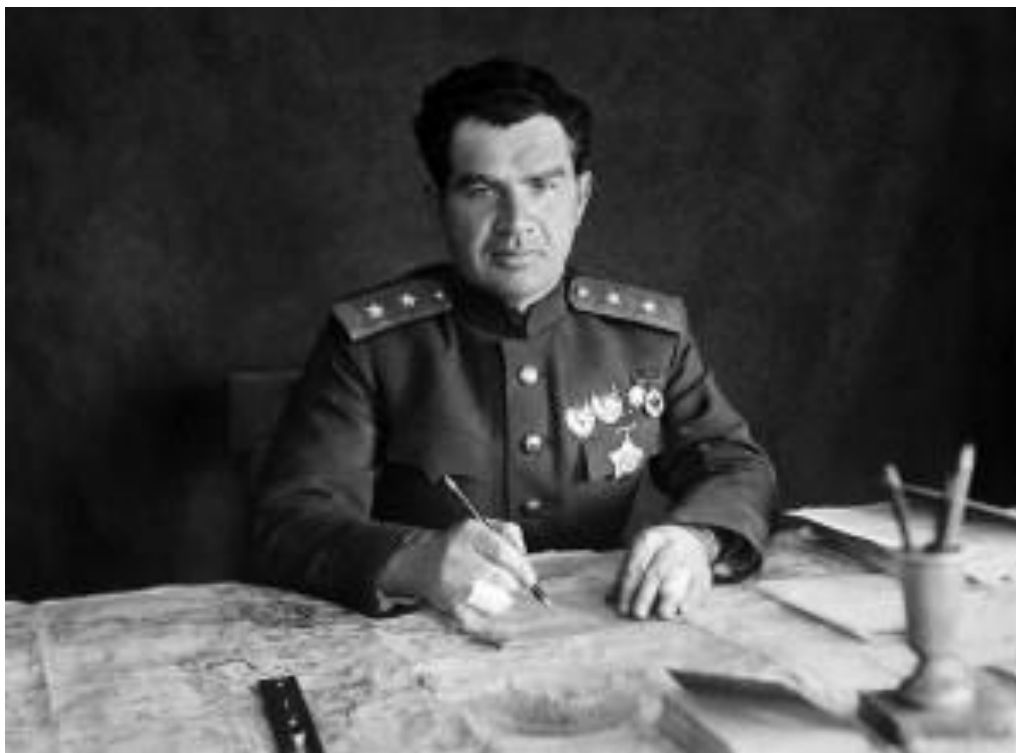
Командующий 62-й армией генерал-лейтенант В. И. Чуйков