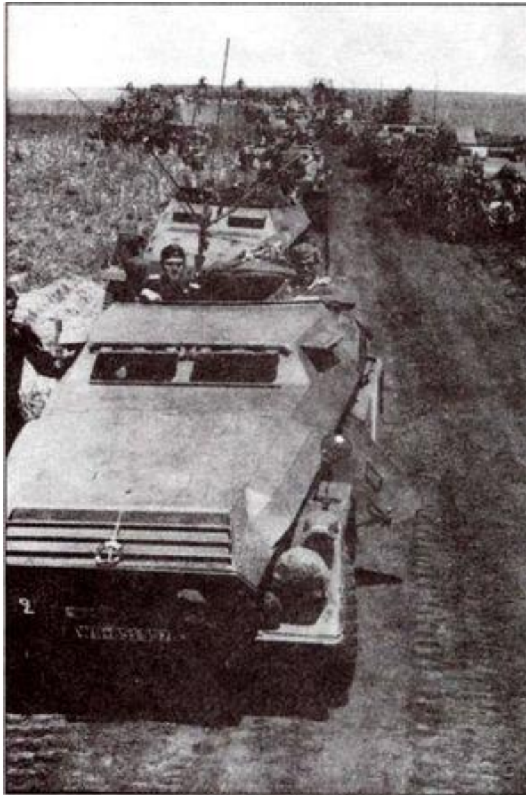
Колонна бронетранспортеров моторизованной дивизии "Великая Германия". Западный берег Дона, лето 1942 года.