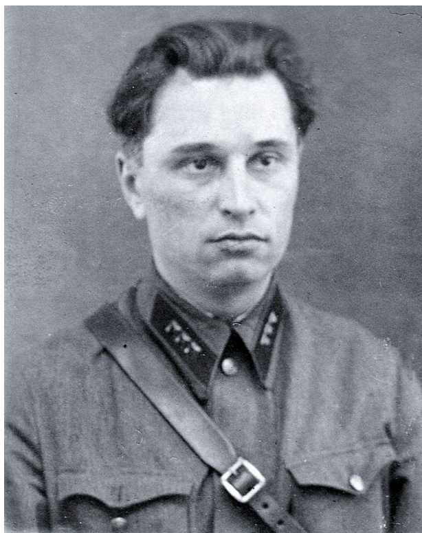
Батальонный комиссар Иван Мефодьевич Щербина

Остаться в таком положении было не возможно. Тогда комиссар приказал прорываться.