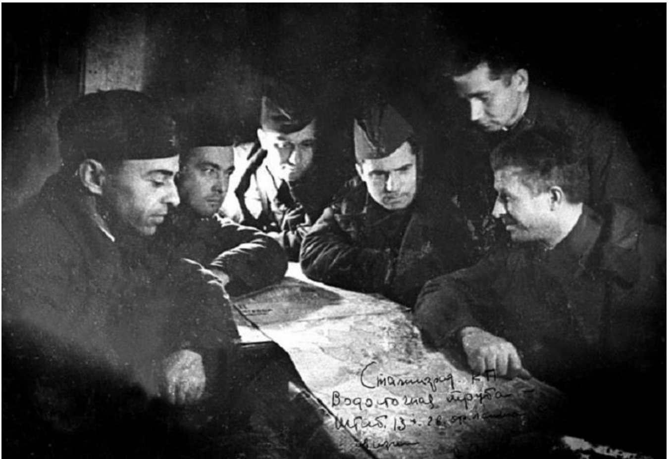
13-я гвардейская дивизия генерала А. И. Родимцева.

В боевом распоряжении №72 14 сентября 1942 г. командующий 62-й армией приказал: «К 3.00 15.9.42 13-ю гв. сд переправить в г. Сталинград».