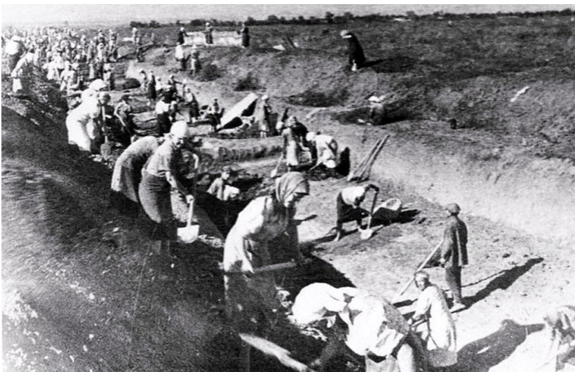
Мирные жители на строительстве противотанковых рвов.

Немцы, заняв круговую оборону, стояли насмерть, организовав эффективную систему огня и на полную мощь задействовав свою авиацию. Немецкие самолёты методически бомбили и обстреливали советские войска ещё на марше, не давая возможности в течение светлого времени организованно подготовиться и вступить в бой.