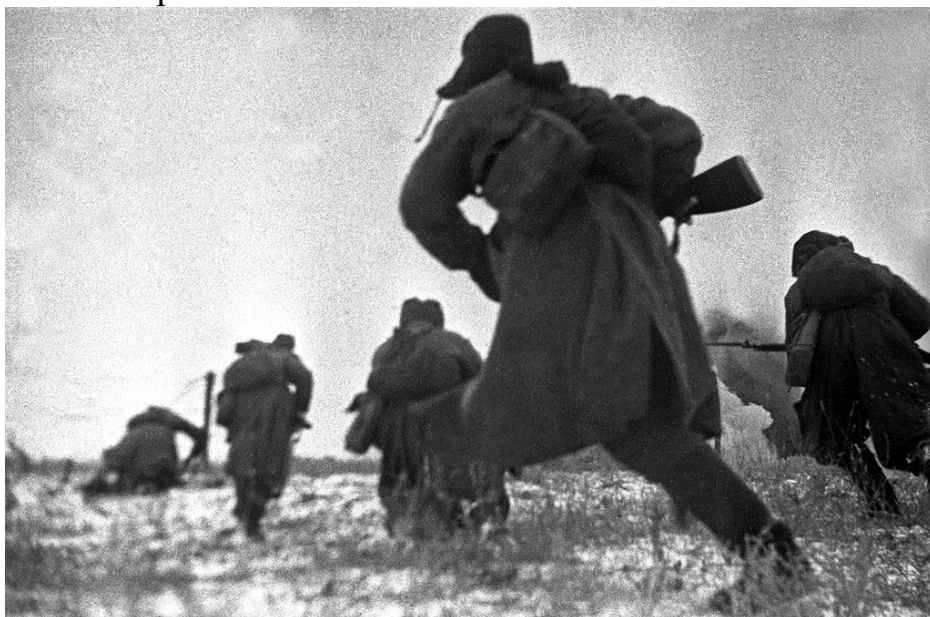
Красноармейцы идут в атаку на врага под Сталинградом. 1942 г.

Советские соединения отражали многочисленные контратаки трёх вражеских дивизий. К исходу 27 августа все контратаки противника с юга были отражены 12-м танковым корпусом, 264-й стрелковой дивизией, 179-й танковой бригадой и южной группой 61-й армии.