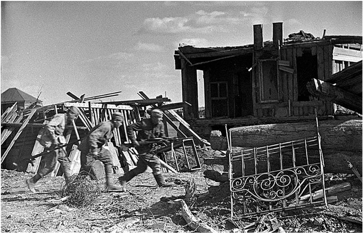
Бойцы занимают исходные позиции. Сталинградский фронт. 1942 г.