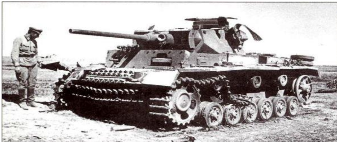
Подбитый немецкий танк. Запасные гусеницы передней части танка подвешены для усиления лобовой брони.

Гитлеровское командование сосредоточило крупные силы 6-й армии в районе хутора Вертячий - Песковатка, пытаясь расширить плацдарм на левом берегу Дона. 4-я танковая и 62-я советские армии вели жестокие бои, сдерживая натиск врага, рвавшегося к Волге. Опасность для Сталинграда значительно возросла.