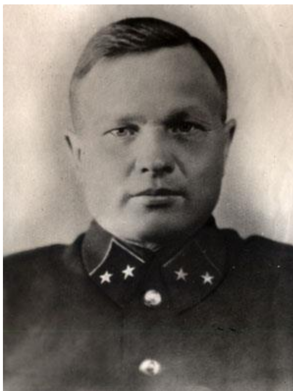
Генерал-майор В. А. Глазков

Советские войска продолжают героически сражаться с превосходящими силами противника. Положение осложняется с каждым днем и каждым часом. 6-я полевая и 4-я танковая армии вермахта ведут наступление по всему фронту – на северных, западных и южных подступах к Сталинграду. К исходу дня противник прервал сообщение Юго-Восточного фронта с 64-й и 57-й армиями. Советское командование вынуждено было переправить командный пункт Юго-Восточного фронта на левый берег Волги.