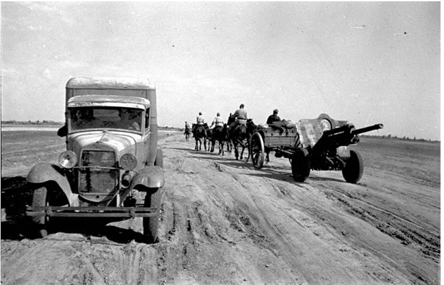
Одна из частей Красной Армии в районе Сталинграда. 1942 г.