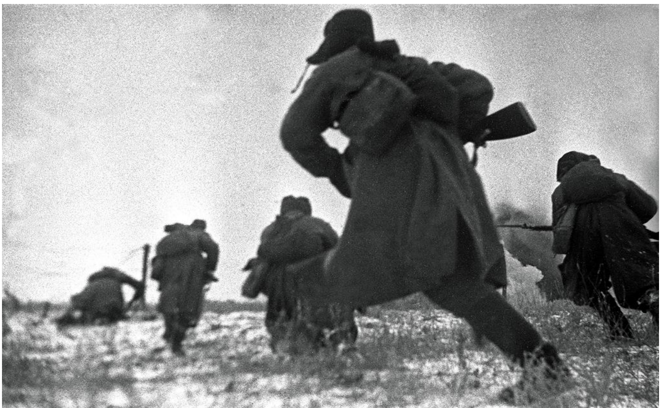
Красноармейцы идут в атаку на врага под Сталинградом. 1942 г.

Воспользовавшись тем, что 1-я танковая армия в течение первых дней наступления сражалась по существу одна, противник сосредоточил против неё большую часть огневой мощи своей артиллерии и крупные силы авиации. 4-я танковая армия запаздывала с началом наступления, а 13-й танковый корпус по-прежнему вёл бои в районе Манойлина. Удар на Верхне-Бузиновку 1-я танковая армия наносила лишь силами 28-го танкового корпуса. 131-я стрелковая дивизия наступала на север вдоль правого берега Днепра, а 158-й тяжёлой танковой бригаде было приказано очистить от противника высоты западного берега Дона. Армия наступала в разные стороны и ни на одном направлении не могла прорвать немецкую оборону.